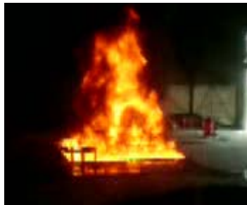
Paso 2: Combustión.