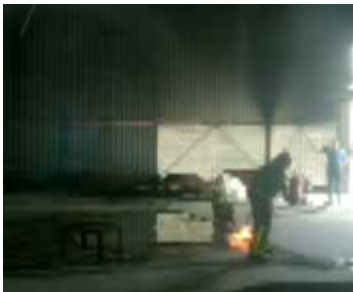
Paso 1: Encendido.

Como combustible se ha empleado 20 litros de gasolina de 98 octanos.